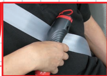
シートベルト カッター