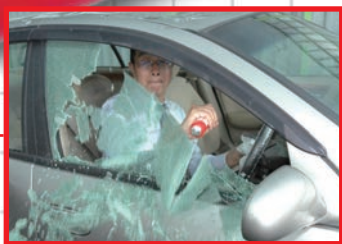
ガラス破碎先端部