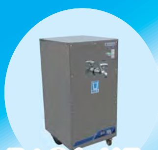
BiG1-MF 中空糸膜 (MF)