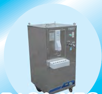
BiG1-MFC 中空糸膜 (MF) 冷水型