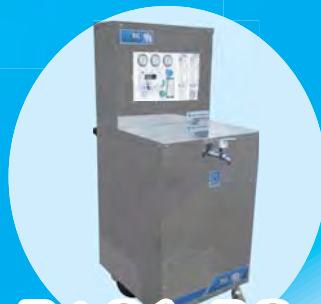
BiG1-RO 逆浸透膜 (RO)